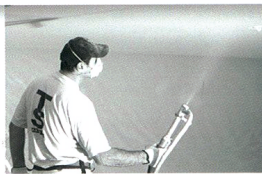
Application de l'enduit de finition (blanc ou coloré)