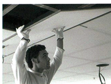
Installation des panneaux