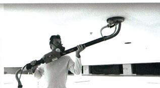
Ponçage des joints