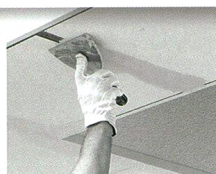
Application de l'enduit de garnissage des joints